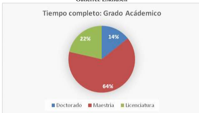
Gráfica 1. Grado académico de los profesores de tiempo completo de la escuela normal Rosario María Gutiérrez Eskildsen

Los organismos de investigación reconocidos en las instituciones de nivel superior son los Cuerpos académicos, para la conformación de los mismos se requiere que los docentes acrediten el perfil PRODEP donde se establecen los siguientes requisitos: ser profesor de tiempo completo; grado de maestría y cumplir con los cuatro rubros que son producción, docencia, tutorías o dirección de tesis y gestión académica.