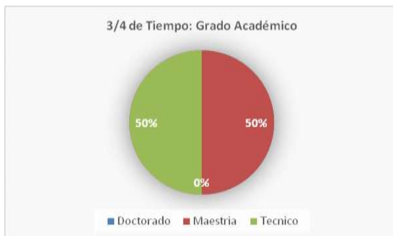
Gráfica 2. Grado académico de los profesores de \frac{3}{4} de tiempo de la escuela normal Rosario María Gutiérrez Eskildsen