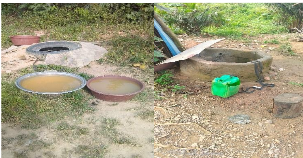
Planche photographique 1 : Eau souterraine contenue dans les puits traditionnels Prise de vue : Aké-Awomon, 2023

A Attéhou, plus des trois quart (86,7%) des ménages possèdent et utilisent l'eau des puits comme source pour s'approvisionner en eau (planche photographique 1).