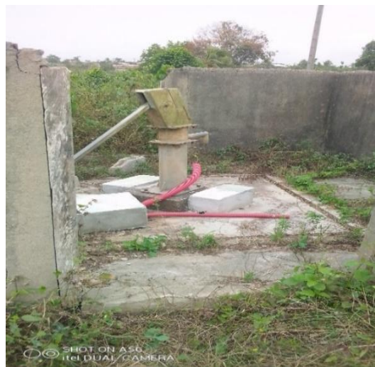
Planche photographique 2 : Pompes à Hydraulique Villageoise à Attéhou Prise de vue : Aké-Awomon, 2023