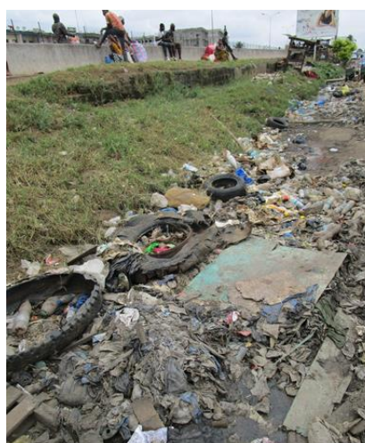
Photo 5: Un caniveau obstrué par des déchets solides ménagers au quartier Gesco