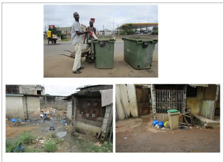
Tableau 1 : Moyens de conservation des déchets solides ménagers au quartier Gesco