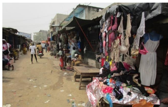
Photo 2: Vente de produits vestimentaires Crédit photo: BAKARY N. Mathieu, Janvier 2023