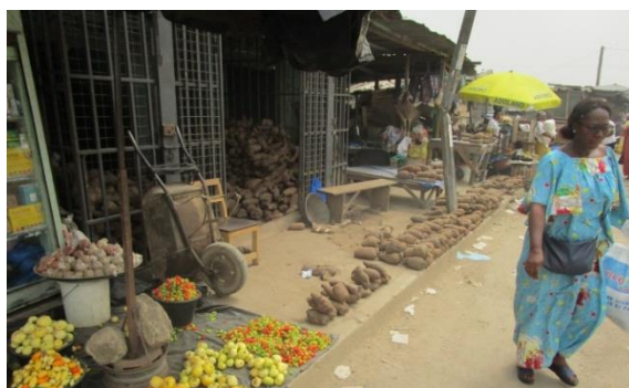
Photo 1: Vente de produits vivriers (Légumes, piments, ignames).

Les commerçants ambulants détaillants contribuent également aux recettes municipales par le paiement de taxes forfaitaires à la Mairie. Chaque jour, les collecteurs de la Mairie leur distribuent des tickets contre paiement d'un montant forfaitaire de 100 F ou 200 F, en fonction de la quantité de marchandises exposée pour la vente.