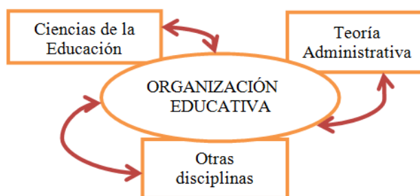
Esquema No. 1 Objeto de estudio de la Administración Educativa y ejes teóricos fundamentales

Con base en lo expuesto hasta aquí, podemos señalar que la organización educativa constituye el objeto de estudio de la Administración Educativa, y, como lo muestra el esquema No.1, la teoría de esta disciplina se construye a partir de la confluencia de tres ejes disciplinares fundamentales: las Ciencias de la Educación, la teoría administrativa general, y otras disciplinas, como la Economía, la Psicología, la Sociología, las Ciencias Políticas y el Derecho, entre otras.